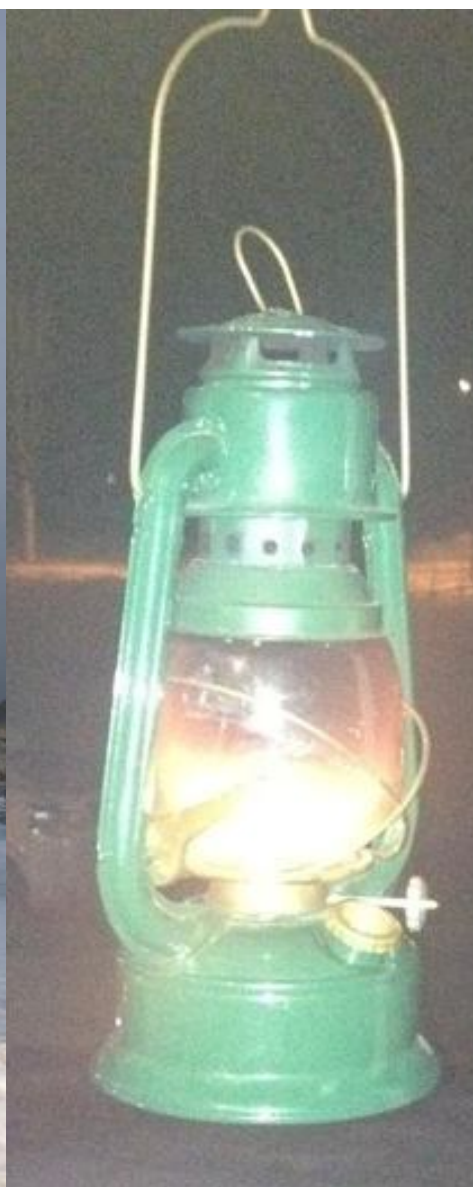
De groene lamp brand zolang er mushers onderweg zijn