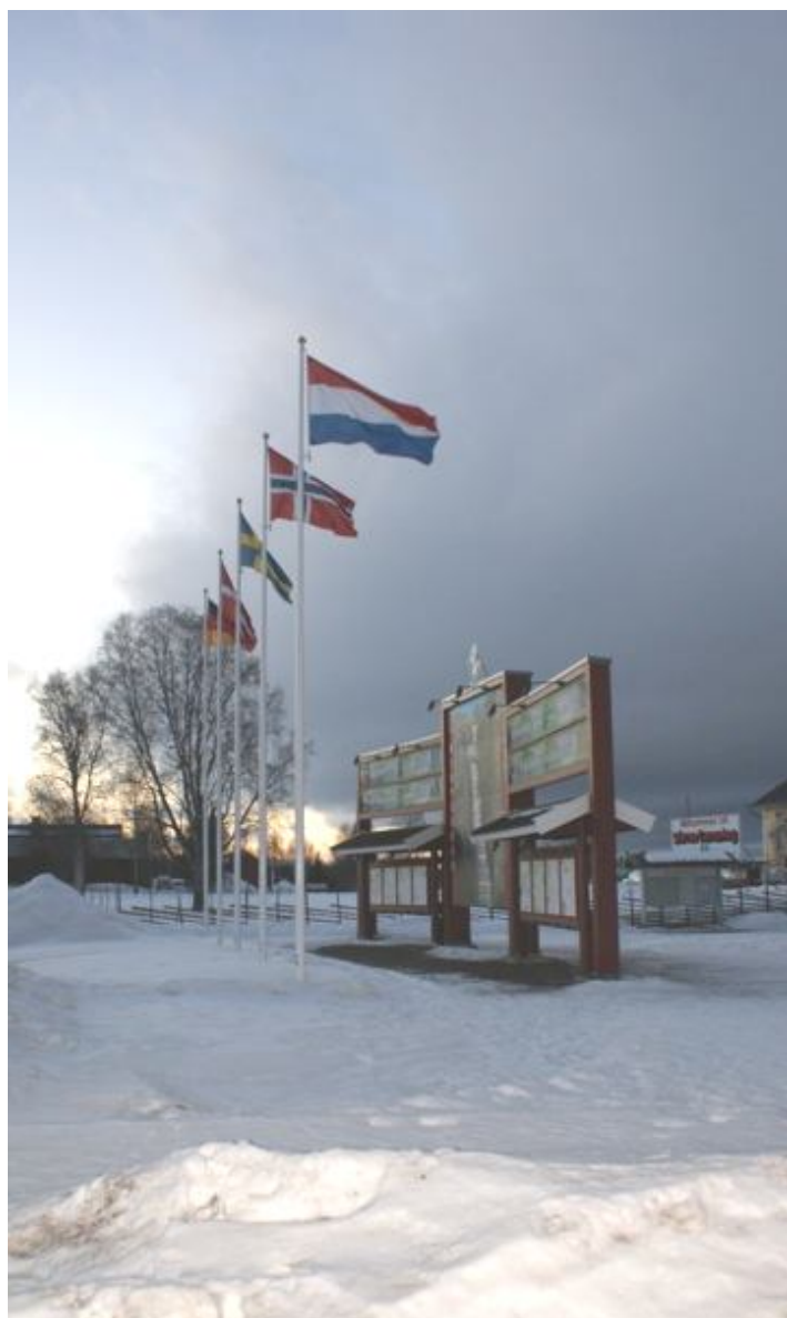
De Nederlandse vlag wappert voor mij

De trail gaat nog hoger en we komen wederom boven de boomgrens uit en daar is het echt slecht weer. De voorste honden zijn nauwelijks te zien evenals de trailmarkeringen en we lopen eigenlijk op gevoel van markering naar markering. De wind gaat verschrikkelijk te keer en blaast mij en mijn honden steeds weer van de trail. Dat is een gevaarlijke situatie. Je loopt op een open gebied en als je steeds verder afwijkt kun je lelijk verdwalen. Een van de leidhonden heeft het erg moeilijk mee om steeds weer terug te keren naar een trail die niet te zien is en ik besluit om een andere leidhond die ik voor dit laatste stuk naar achteren had gezet, weer terug in lead te zetten. Hij leidt mij feilloos door de storm met vele obstakels en na een totale tijd van ongeveer 29,5 uur komen wij rond 17:35 uur onder de finishvlag door. We hebben 't gered. Dat gevoel is met geen pen te beschrijven.