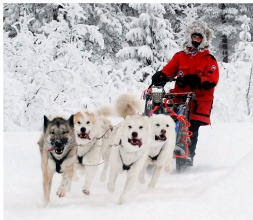
De trainingen zijn begonnen