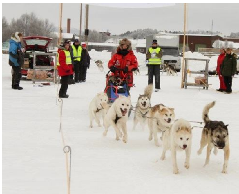
De eerste start

In iets minder dan 6 uur bereik ik het eerste checkpoint in Häggingsnavällén. Hier hou ik mijn eerste bivak en in mijn hoofd heb ik zo'n bivak al vele male geoefend, maar in het echt is het wel heel anders. De zorgen van: gaan mijn honden wel slapen, blijven ze rustig als ze andere honden zien gaan en komen etc.... waren totaal overbodig. Op het moment van binnenkomen wil je eigenlijk zoveel mogelijk dingen tegelijk doen om de honden zo snel mogelijk hun rust te kunnen geven.