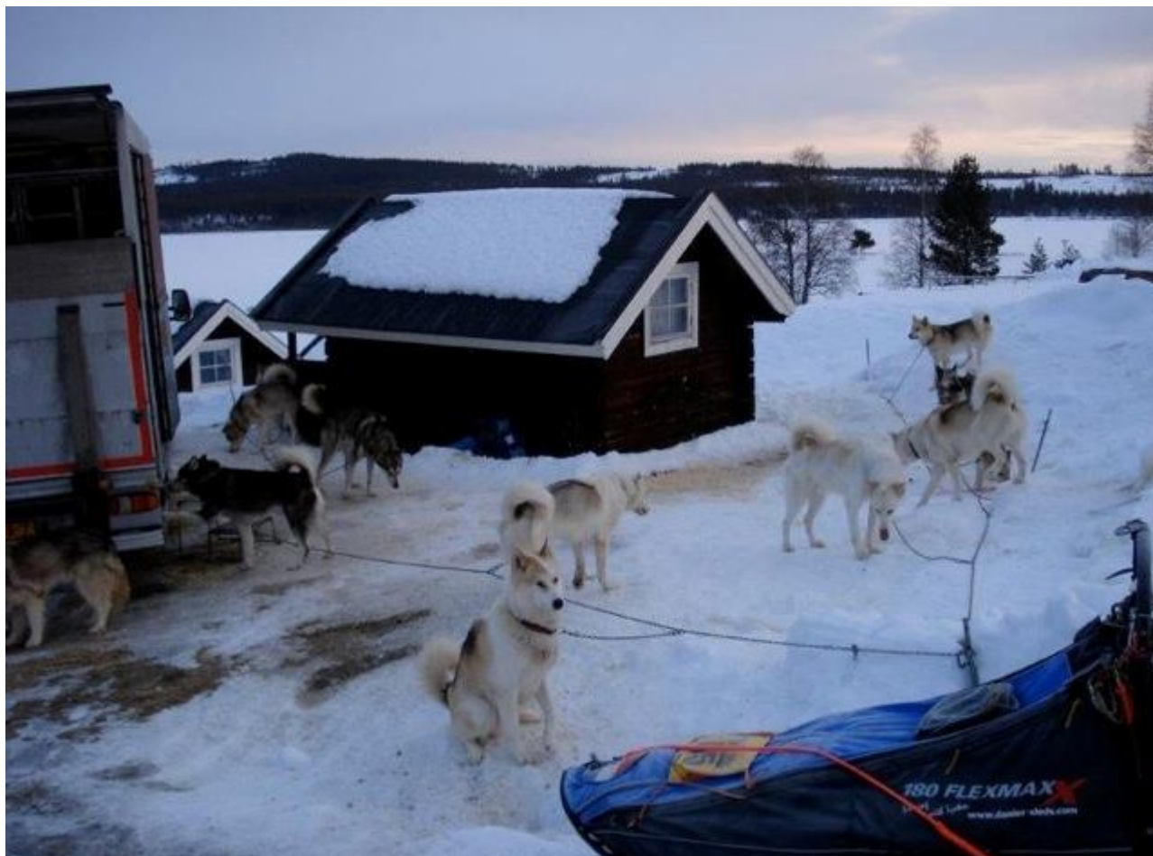
De cabin is kleiner dan mijn auto

Ik heb een 'cabin' gehuurd en die bleek nog kleiner te zijn dan mijn auto. Oké toegegeven ik heb een grote auto. Maar de honden staan erbij en binnen is het warm. In de cabin naast mij verblijft ook een Groenlander die ik in Røros ontmoet heb en hij geeft mij nog wat extra tips en informatie. Ik testte ook even hoe zwaar zijn slee was en besepte dat zijn slee ook heavy was. Maar goed hij ging voor de 300 km.